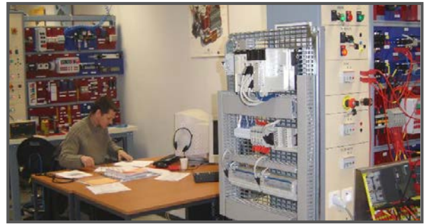
Plusieurs espaces (150 m 2 minimum) équipés de postes multimédias et d'équipements techniques sont dédiés à la réalisation de travaux pratiques.

Après votre acceptation du dossier, le salarié suivra son parcours avec un accompagnement personnalisé et permanent du formateur. Un suivi informatisé permettant de retrouver la formation là où elle a été laissée.