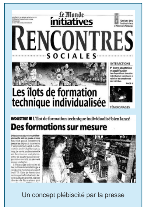
Un concept plébiscité par la presse

Personnels de production et de maintenance en accès libre et immédiat