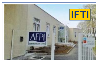
AFPI Diors (Châteauroux) Rue Lafayette - ZI La Martinerie