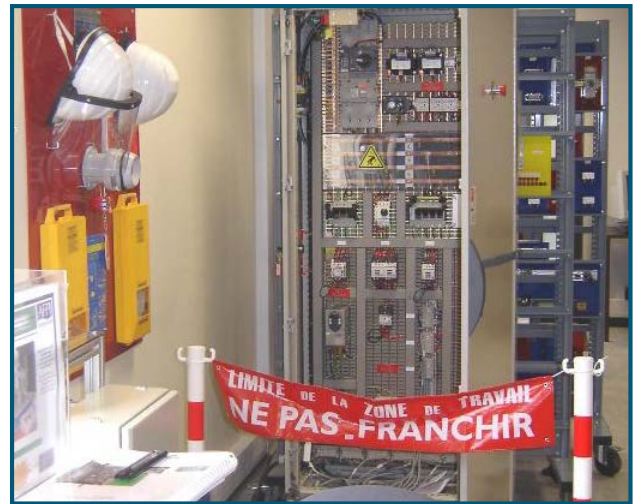
En habilitations électriques (armoires et équipements de protection) permettent une mise en situation pratique.

Nous vous proposons des formations continues mais aussi des certifications grâce aux CQPI/CQPM de la métallurgie.