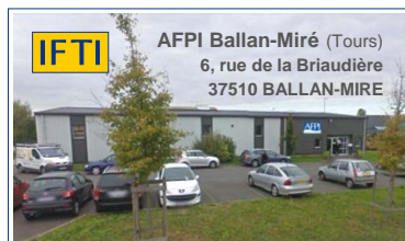
BALLAN MIRE (Tours)